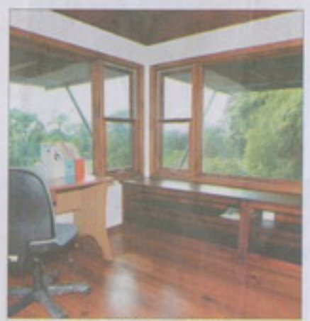
這是間獨立書房，360度開窗，視野相當好。