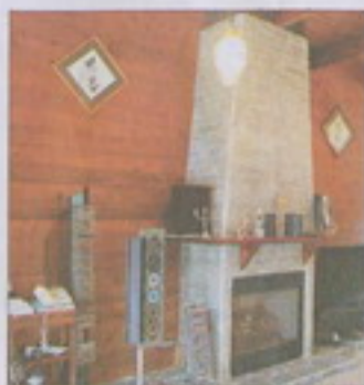
A棟主人客廳有壁爐，是特別指定做的。