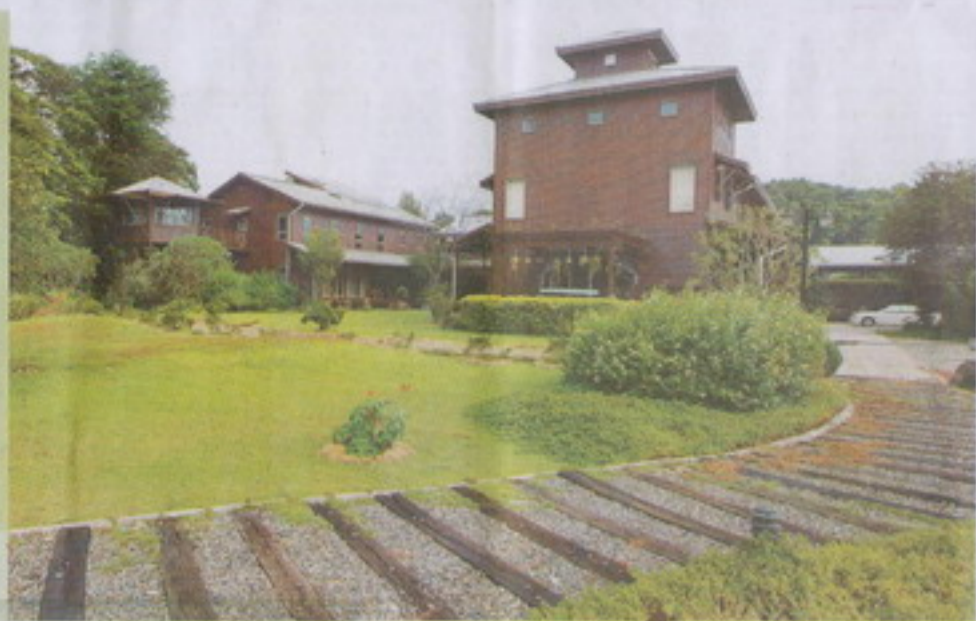
南投中寮鄉木造三合院農莊。