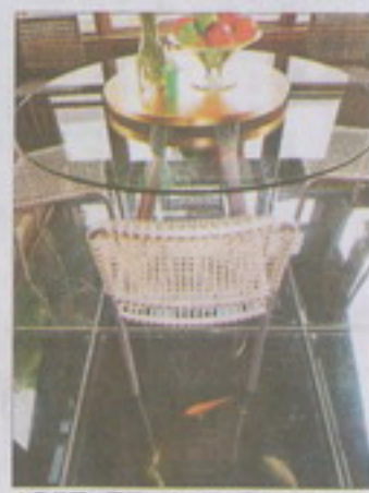
在早餐間，隔著玻璃地板，看著地板下的魚兒悠游，一邊享用早餐，相當怡然自得。