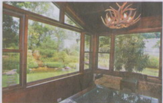
C棟一樓是農莊主人特別為母親打造，大面積的餐廳視野極佳，桌子上方是用魚角拱起來的燈具。

燒萬百瓶連的DVD收藏室，沿著樓梯上樓，書房挑高近十米，層層疊疊，裝潢得比誠品書店還有書香味。