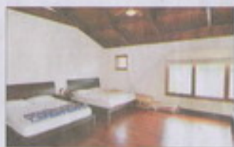
B棟二樓是三間客房，中式洋式風味都有。